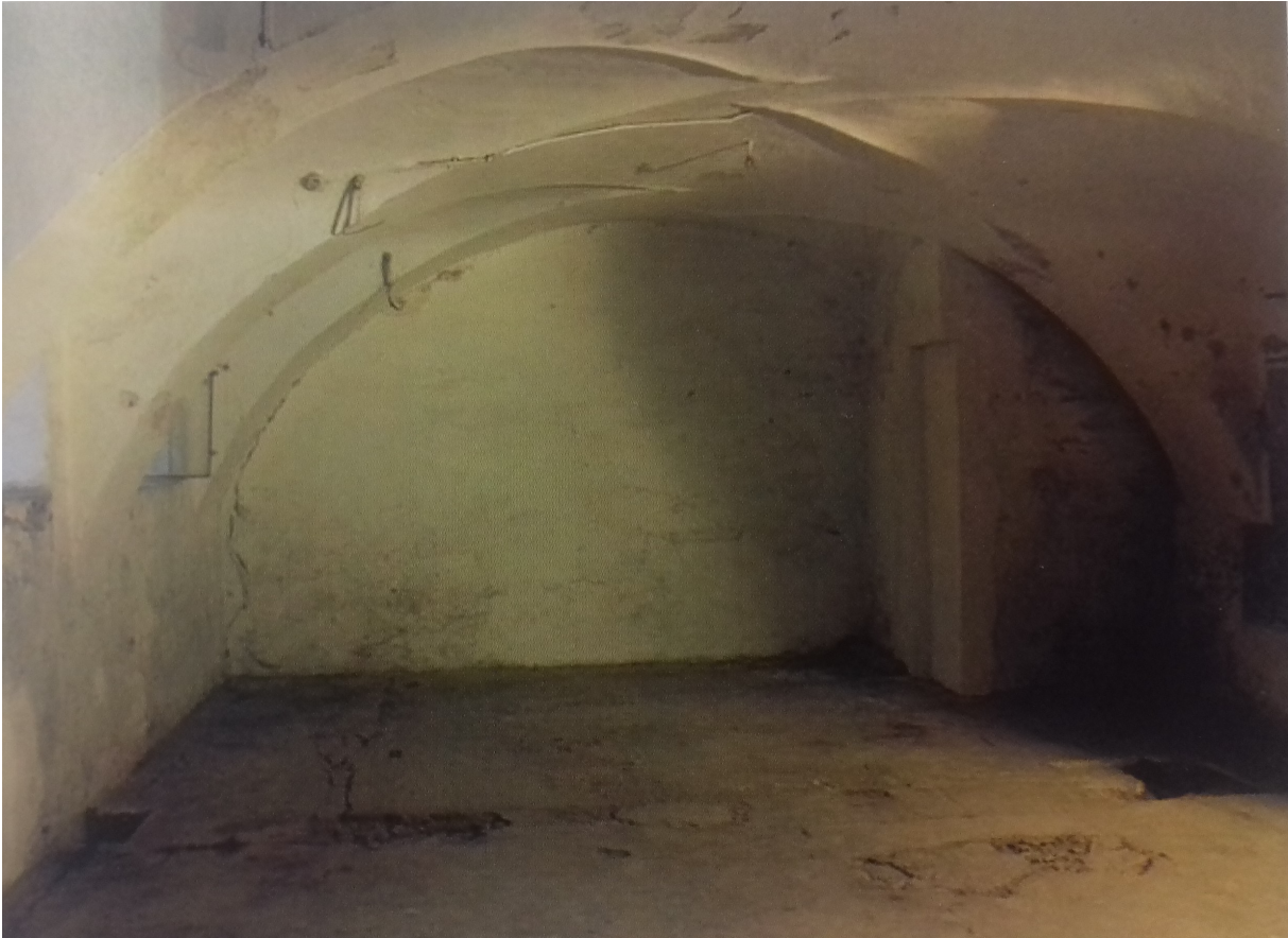
Εικόνα 3. Το εσωτερικό του κρεματορίου σε φωτογραφία του 2002.

Αν και τον Αύγουστο του 1941, το πρόγραμμα της ευθανασίας διακόπηκε, οι χώροι εξόντωσης, μαζί και το Χαρτχάιμ, συνέχισαν να λειτουργούν, συνδεδεμένοι πλέον με τις ανάγκες του διαρκώς διογκούμενου ναζιστικού στρατοπεδικού σύμπαντος. Ο Αρχηγός των Ες-Ες, Χάινριχ Χίμλερ, είχε διατάξει από τον Απρίλιο του 1941 την εφαρμογή του σχεδίου «14 f 13», δηλαδή των εξόντωση όσων ομήρων και αιχμαλώτων ήταν υπερβολικά αδύναμοι ή ασθενείς, και από τον Ιούλιο άρχισαν να φτάνουν στον Πύργο κρατούμενοι από το Μαουτχάουζεν και το Νταχάου που είχαν επιλεγεί έπειτα από ιατρική εξέταση. Το 1942 και το 1943 οι αποστολές σταμάτησαν σχεδόν τελείως για να ξεκινήσουν ξανά τον Απρίλιο του 1944, όταν ο Πύργος ουσιαστικά ενσωματώθηκε στο σύστημα λειτουργίας των στρατοπέδων συγκέντρωσης. Μέχρι τα μέσα Δεκεμβρίου της ίδιας χρονιάς, όταν το Χαρτχάιμ έκλεισε οριστικά και το