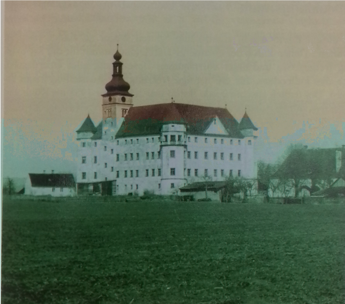
Εικόνα 1. Ο Πύργος το 1940-41. Λήψη από τα δυτικά.

Πολλοί από τους κρατούμενους του Μαουτχάουζεν που επιλέγονταν για εξόντωση, λόγω σωματικής αδυναμίας ή ασθενειών, στέλνονταν στον Πύργο του Χαρτχάιμ (Schloss Hartheim) ένα κάστρο του 17ου αιώνα, εξαιρετικού αρχιτεκτονικού κάλλους, περίπου 25 χιλιόμετρα δυτικά του Λιντς. Από το 1898 είχε μετατραπεί σε πρότυπο ψυχιατρείο-σανατόριο υπό τη διεύθυνση του Υπουργείου Πρόνοιας του κρατιδίου της Άνω Αυστρίας. Στα τέλη της δεκαετίας του '30 η λειτουργία του Πύργου ως κέντρου φροντίδας των ψυχικά ασθενών –και μάλιστα πρότυπου– τερματίστηκε βίαια· ο Πύργος μετατράπηκε μάλιστα σε ένα από τα πλέον εφιαλτικά τοπία της ναζιστικής θηριωδίας. Με την προσάρτηση της Αυστρίας στο Γ΄ Ράιχ το 1938, οι