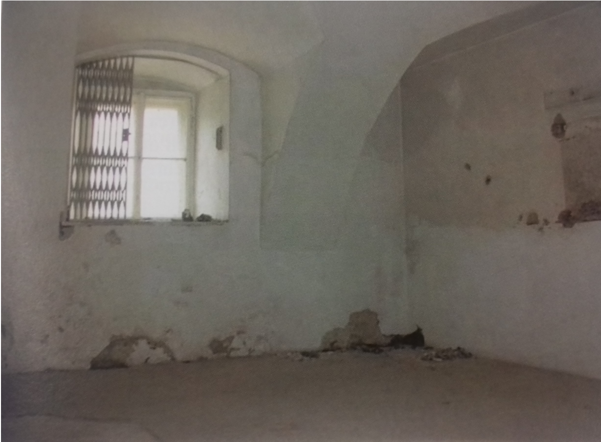
Εικόνα 2. Το εσωτερικό του θαλάμου αερίων σε φωτογραφία του 2002.

Τα θύματα υποβάλλονταν σε διάφορες εξετάσεις και ιατρικά πειράματα και τελικά δηλητηριάζονταν μαζικά σε έναν αεροστεγώς κλεισμένο θάλαμο αερίων με το δραστικό παρασιτοκτόνο Τσικλόν Μπε (Zyklon B), το ίδιο που χρησιμοποιούνταν στο Άουσβιτς και στα άλλα στρατόπεδα εξόντωσης των Εβραίων. Οι γιατροί αφαιρούσαν όργανα και συχνά τους εγκεφάλους των νεκρών και τα διατηρούσαν στη φορμόλη ως δείγματα, για «ερευνητικούς» σκοπούς. Τα πτώματα καίγονταν σε ένα ειδικό κρεματόριο, τα κόκκαλα διαλύονταν σε ένα ηλεκτρικό γουδοχέρι, η στάχτη έμπαινε σε μεγάλα τσουβάλια τα οποία μεταφέρονταν με λεωφορεία (τα ίδια λεωφορεία που είχαν μεταφέρει τους δυστυχισμένους) στον Δούναβη, όπου αδειάζονταν το περιεχόμενό τους. Την όλη διαδικασία ολοκλήρωνε η ανατριχιαστική συγκάλυψη του εγκλήματος: οι συγγενείς των θυμάτων ενημερώνονταν επίσημα μέσω επιστολών πως οι άνθρωποί τους είχαν «δυστυχώς» αποβιώσει, συνέπεια, υποτίθεται, κάποιας ασθένειας ή κάποιας επιπλοκής της υγείας τους (!).