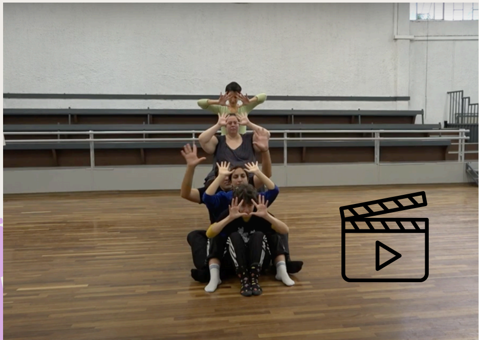
MARY WIGMAN, The Witch Dance, 1926