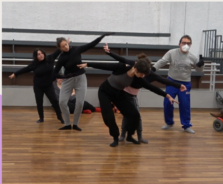
MERCE CUNNINGHAM, Beach Birds , 1991-1993